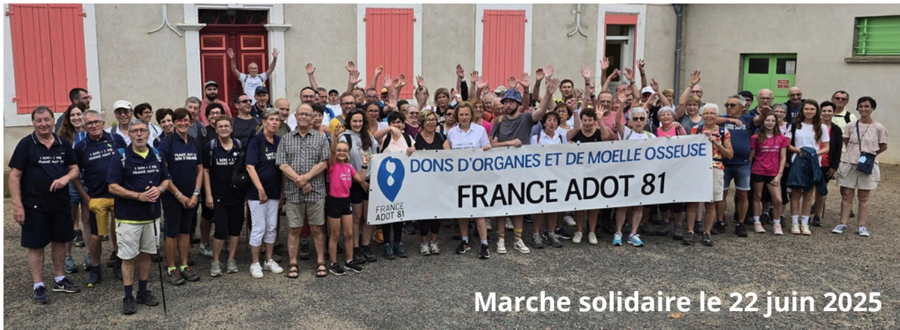
Marche solidaire le 22 juin 2025

DONNER, C'EST OFFRIR UNE SECONDE CHANCE À LA VIE.