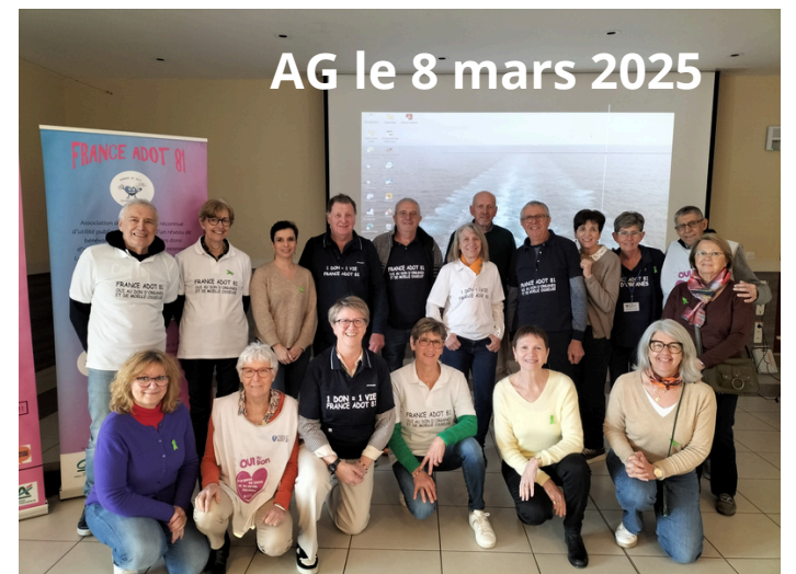
AG le 8 mars 2025