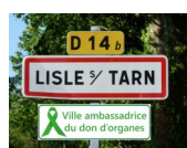
Lisle sur Tarn