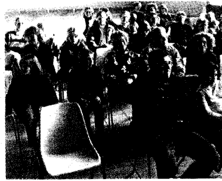
Du côté du public.

Flûte à bec, guitare, clavier, saxo, batterie... Les traditionnelles auditions de Noël sont chaque année l'occasion, pour chacun des élèves de l'école de musique locale, de donner un bel aperçu de leur jeune talent d'instrumentistes.